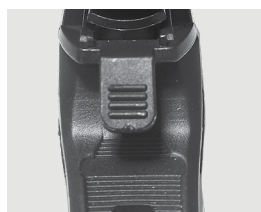
Botón de bloqueo