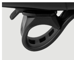
Soporte de correa de silicona